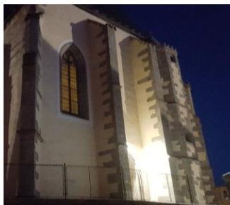
nové osvětlení vnějšku i vnitřku