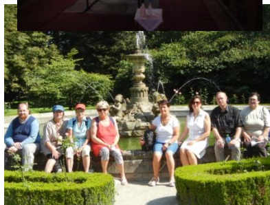
foto za farní dovolené v Kroměříži