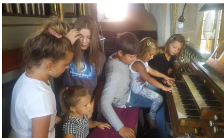
Děti připravující se na svůj křest v září si mohly vyzkoušet s hru na varhany.