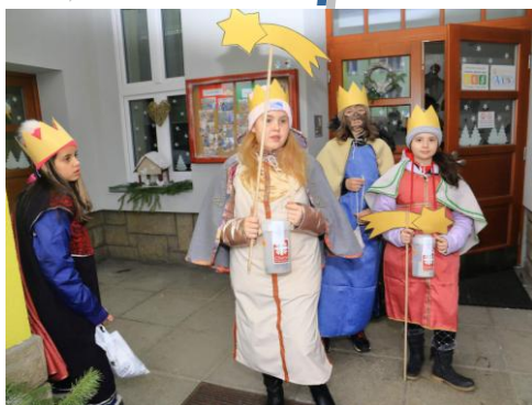
Děti, a nejen z Benešova se účastnily Tříkrálové sbírky