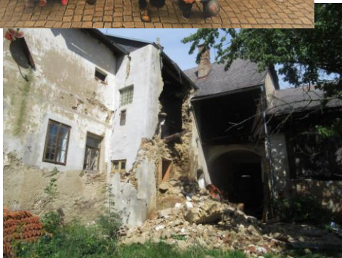
Postupné řízení fary v Malontech sice může být znamením i dalšího rozpadání – vztahů, života ve farnostech, ale i výzvou k většímu úsilí k záchraně.