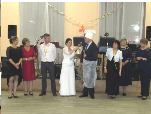
Zdařilý a zábavný Křesťanský ples