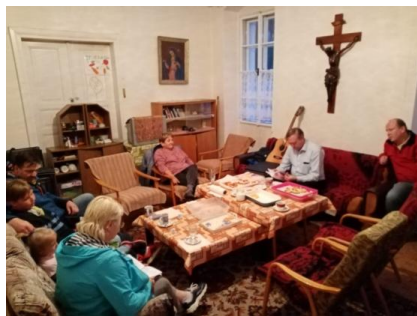
foto ze setkání na faře