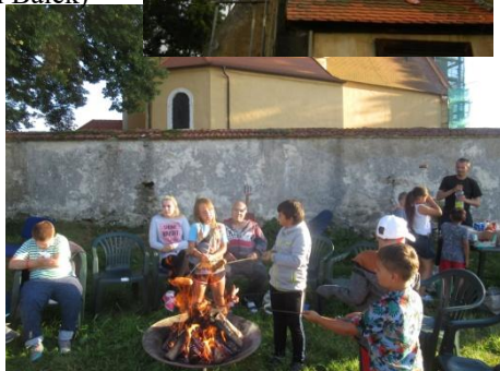
z táboráku pro děti