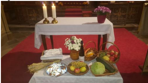
Děkuvzdání za úrodu se konalo kvůli pandemii jenom v málokteré naší farnosti