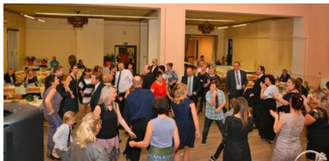
foto z Křesťanského plesu a noci kostelů