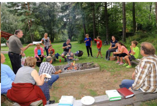
V létě jsme v několika farnostech konali táboráky.