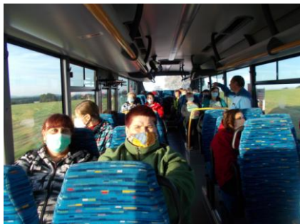
Hezký byl také zářiový poutní zájezd do Znojma.