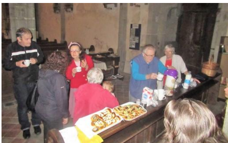
foto z poutní oslavy v září