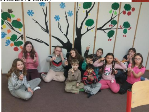
Z výuky náboženství v Malontech.