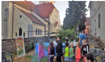
z táboráku a her pro děti na faře