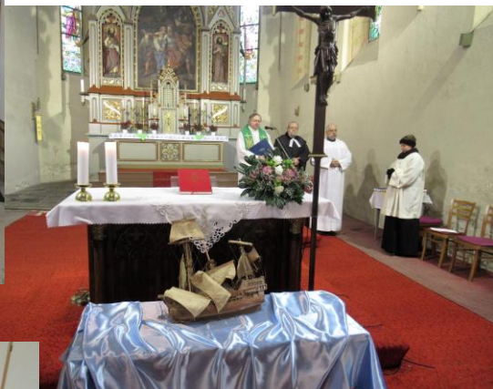
Vydařená ekumenická bohoslužba v Kaplici Téma: o ztroskotání apoštola Pavla na lodi a co dobrého z toho vzešlo