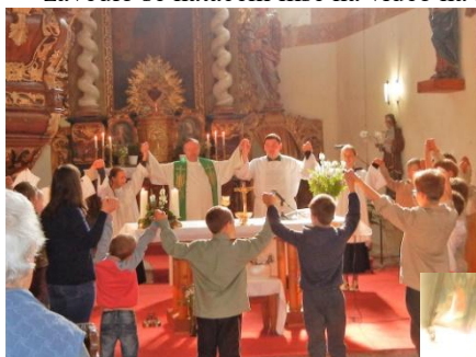
z dětské mše sv. - společně se skauty