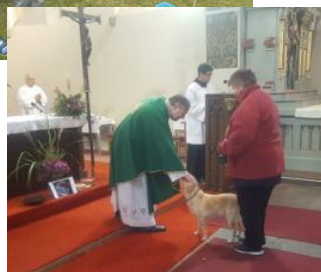
foto ze dne modliteb za přírodu 2019