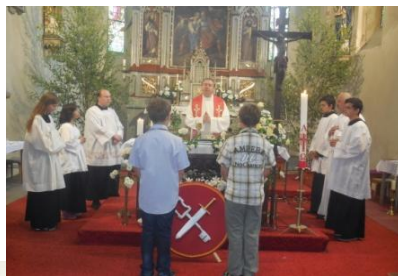
z Petropavlovské pouti 2017