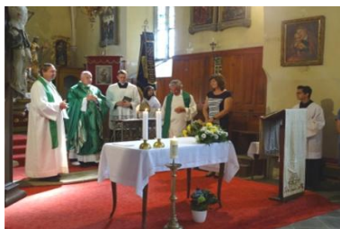
biskup Vlastimil v Rožmitále 2017