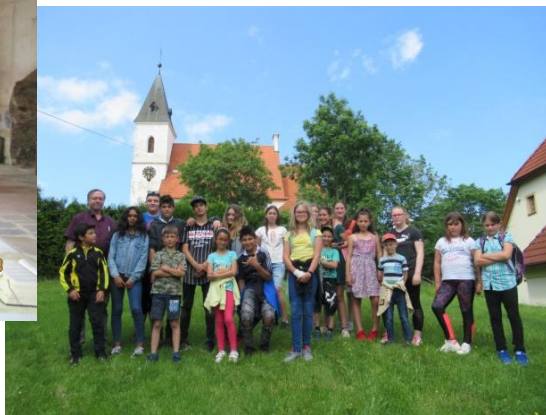
z víkendového pobytu na Ktiši r.2019 ⇨