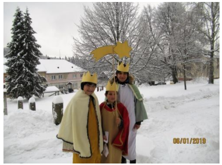
z Tříkrálové sbírky v r. 2019