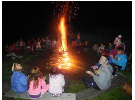
z víkendového pobytu na Dálavě r.2016