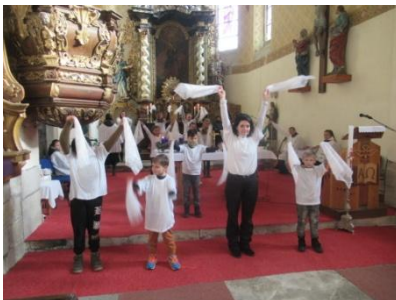
dětské vystoupení na hudbu Blahoslavení milosrdní