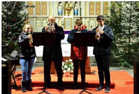
koncertu ZUŠ v r. 2019