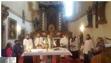
dětská mše sv. v den Země