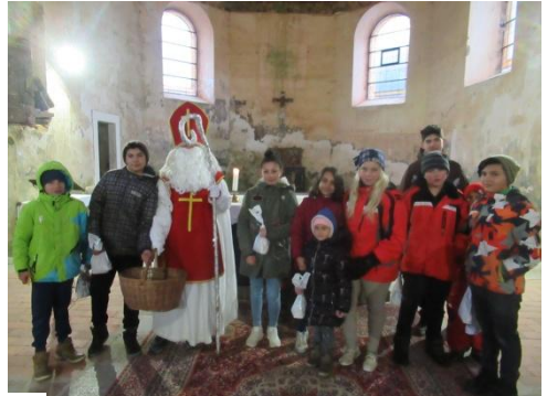
a z Mikulášské nadílky