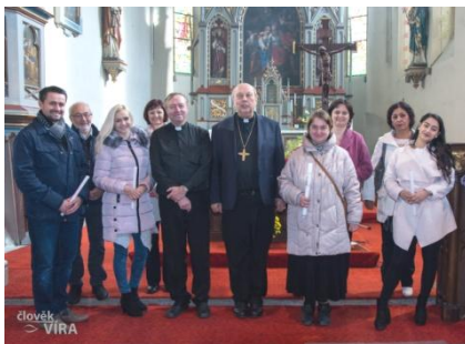
z biřmování v Kaplici 2018

Farnosti: Benesov n. . Blansko u Kaplice Cetviny, D. Dvoriste, Kaplice, Malonty, Omlenice, Pohorska Ves, Pohor n. ., Rozmítal n. . Rychnov nad Mals