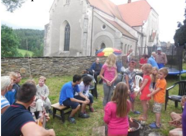
z farního táboračky 2017