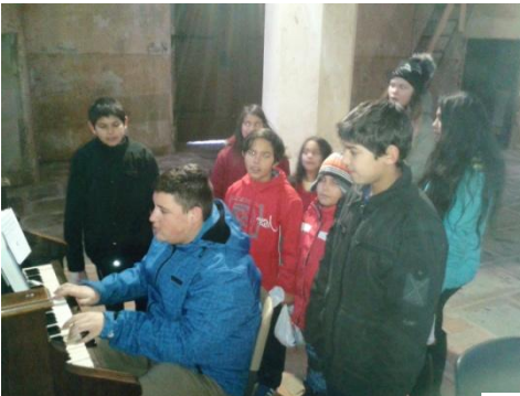
z Mikulášského zpívání