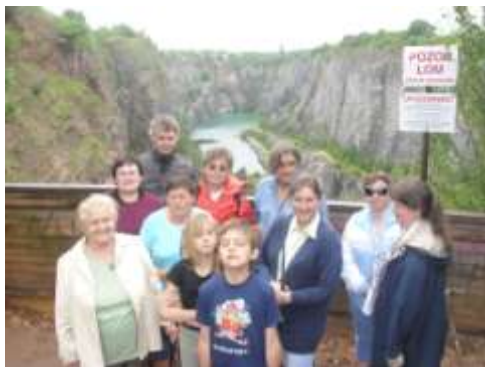
foto z farní dovolené